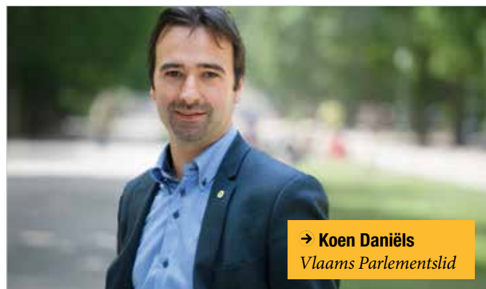
→ Koen Daniëls Vlaams Parlementslid