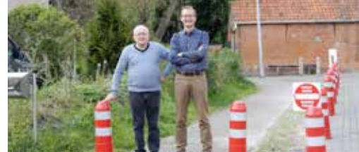
U meldt, wij kaarten aan! p. 3