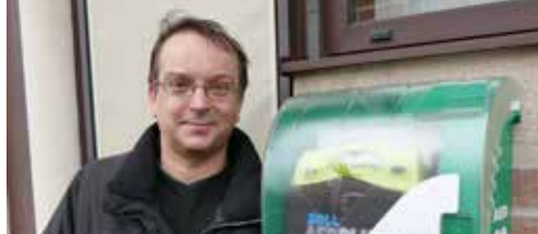
Uw hart, onze zorg p. 2